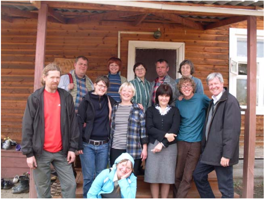
Gruppenbilder aus Istok